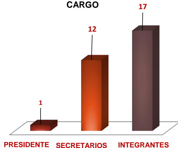
COMPOSICIÓN DE LA COMISIÓN POR CARGO